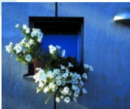
Wie sieht Ihr Traumhaus aus?