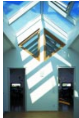
Kreativität in ihrer schönsten Form: